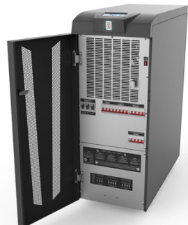
Sentryum Active с открытой дверцей

Функция компенсации напряжения зарядки в зависимости от температуры предотвращает чрезмерный заряд батареи и перегрев. Тестирование аккумуляторных батарей с целью своевременной диагностики снижения производительности или проблем с батареями. Защита от глубокого разряда: во время