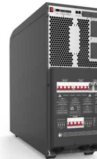
Вид сзади Sentryum Compact.

Современные нормативы и экологически рациональные передовые методики побуждают нас создавать и проектировать ИБП, уделяя особое внимание всему жизненному циклу продукта, с применением новейших и отказоустойчивых технологий, перерабатываемых материалов и миниатюризации сборок, обеспечивая при этом общую надежность систем, что является ключевой характеристикой для любого ИБП. Внутренняя схема платы оптимизирована для уменьшения количества компонентов, сокращения количества соединений и требуемого пространства, с одновременным повышением общей надежности и среднего времени наработки на отказ (MTBF), а