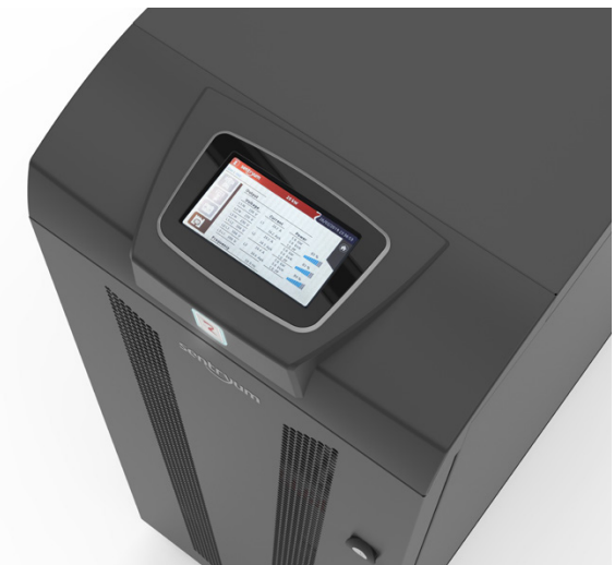
Графический дисплей с сенсорным экраном