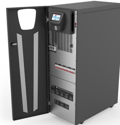
Sentryum Xtend with open door